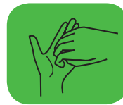
...les ongles et le bout des doigts