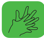
...entre les doigts