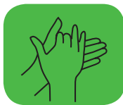
frotter la paume des mains