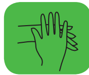
...l'extérieur des mains